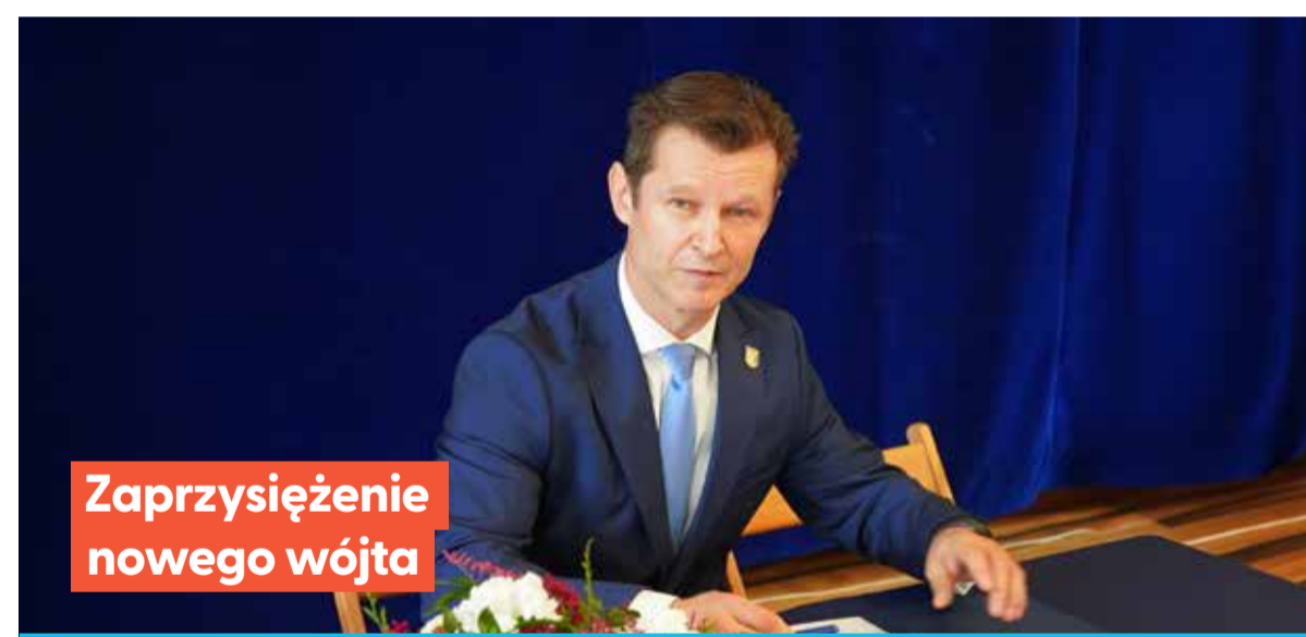
Zaprzysiężenie nowego wójta

Nowo wybrani radni złożyli uroczyste ślubowanie, zobowiązując się do rzetelnego i uczciwego pełnienia swoich obowiązków na rzecz mieszkańców Gminy Malczyce.