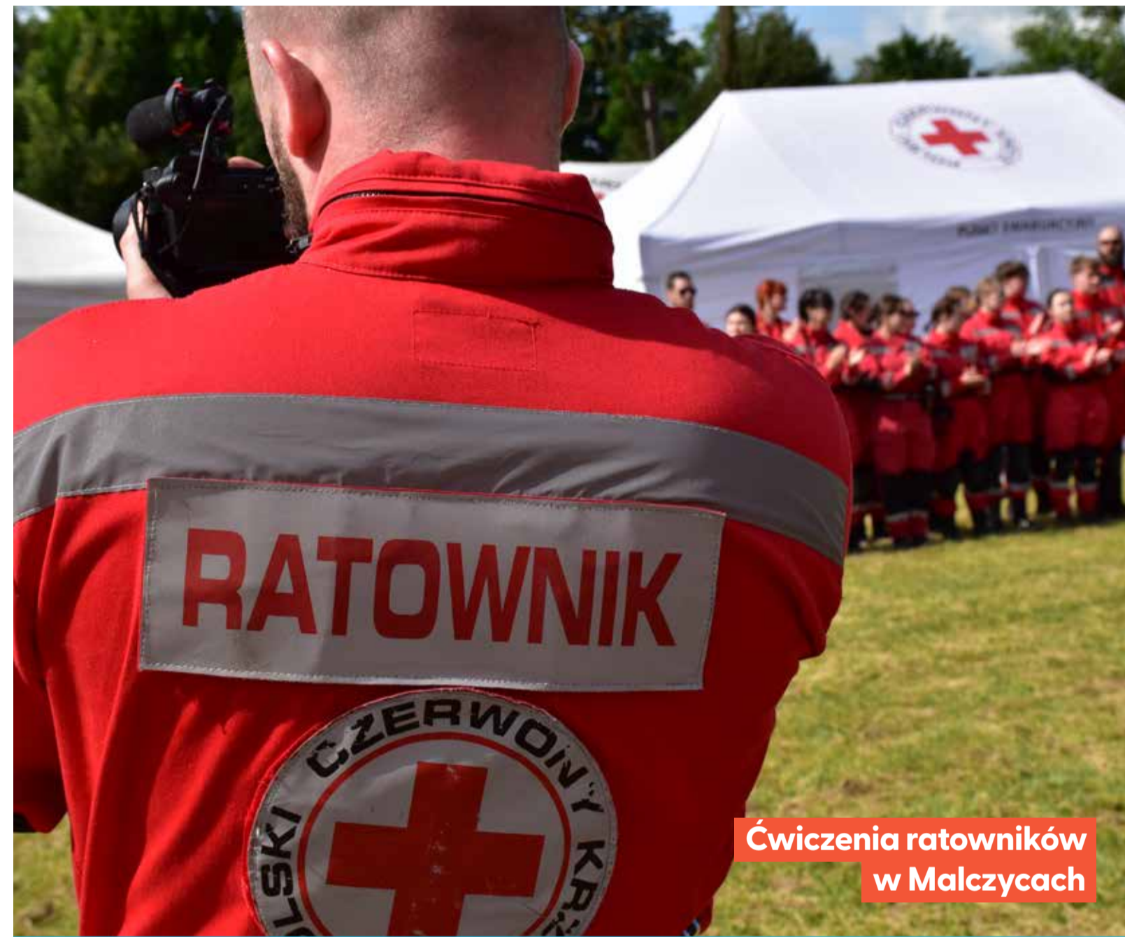
Ćwiczenia ratowników w Malczycach

Od 19 do 22 czerwca w Malczycach na Dolnym Śląsku trwały intensywne, czterodniowe ćwiczenia z udziałem ratowników z całej Polski oraz gości z Litwy, Łotwy, Estonii i Hiszpanii. W zgrupowaniu wzięło udział 150 osób, które przez kilka dni doskonaliły swoje umiejętności w zakresie działań poszukiwawczo-ratowniczych w warunkach katastrofy budowlanej. Organizatorem wydarzenia była wrocławska Grupa Ratownictwa Medycznego Polskiego Czerwonego Krzyża.