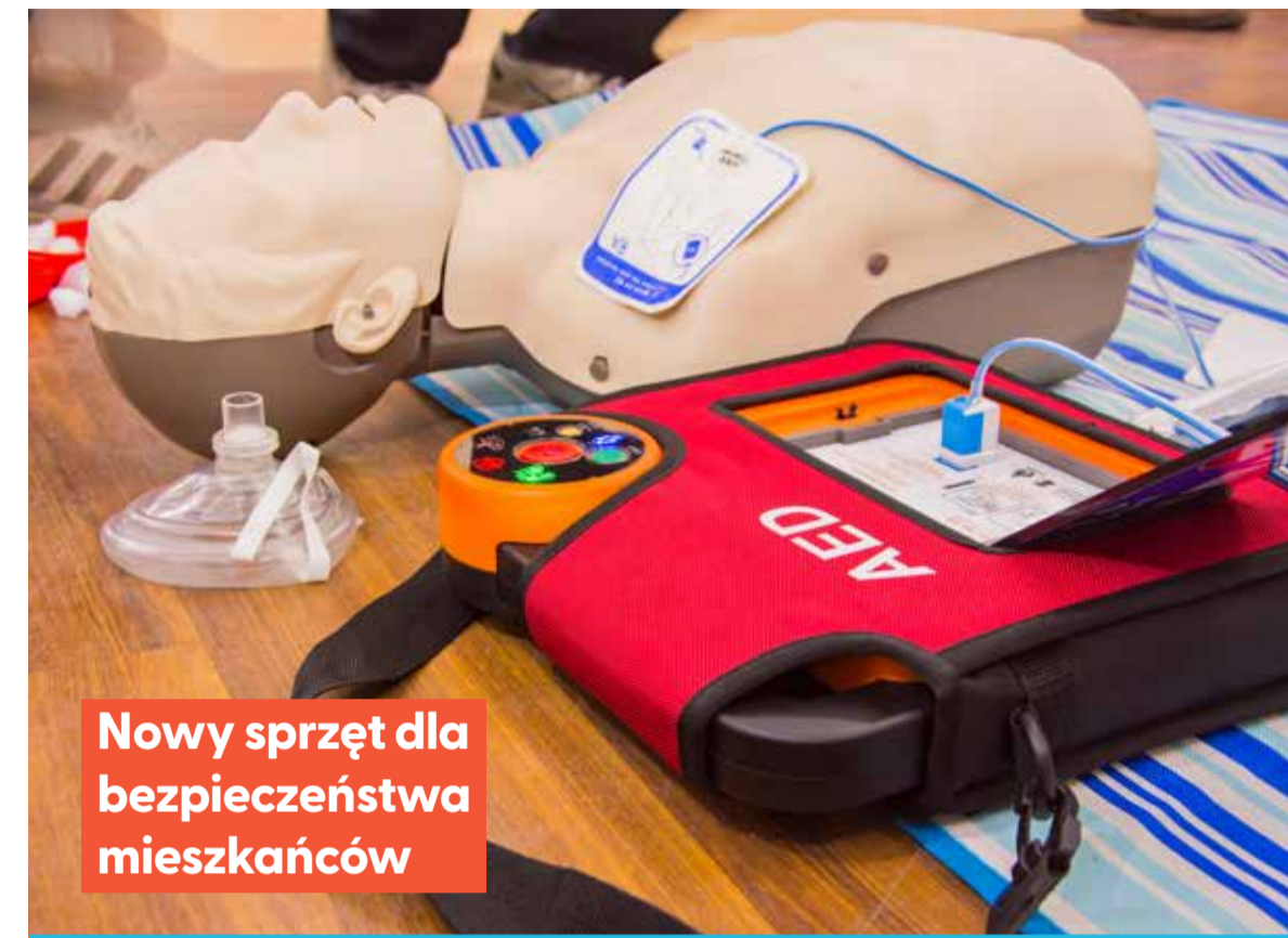
Nowy sprzęt dla bezpieczeństwa mieszkańców

Na zadania inwestycyjne przeznaczono 367 533,74 zł. W ramach tej kwoty zakupiono: