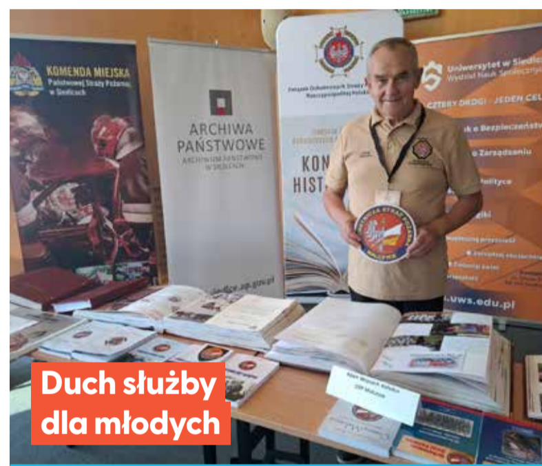
Duch służby dla młodych