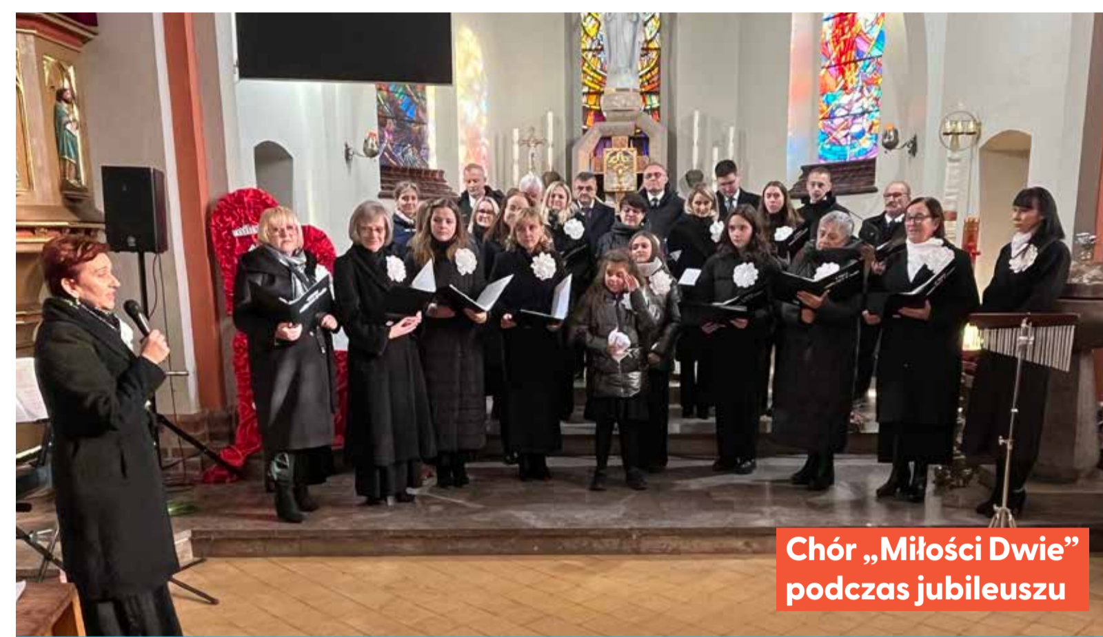
Chór „Miłości Dwie” podczas jubileuszu

Po mszy świętej odbył się koncert jubileuszowy, będący prawdziwą uczcą dla ducha. Publiczność nagradzała każdy występ gromkimi brawami, a w powietrzu unosiła się atmosfera radości i wspólnoty.