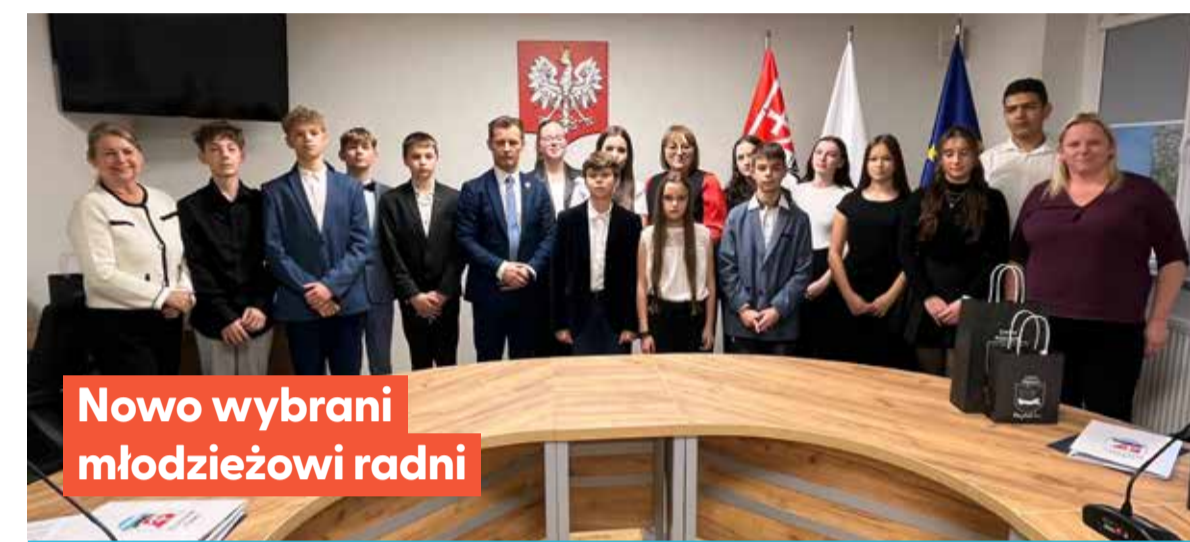
Nowo wybrani młodzieżowi radni