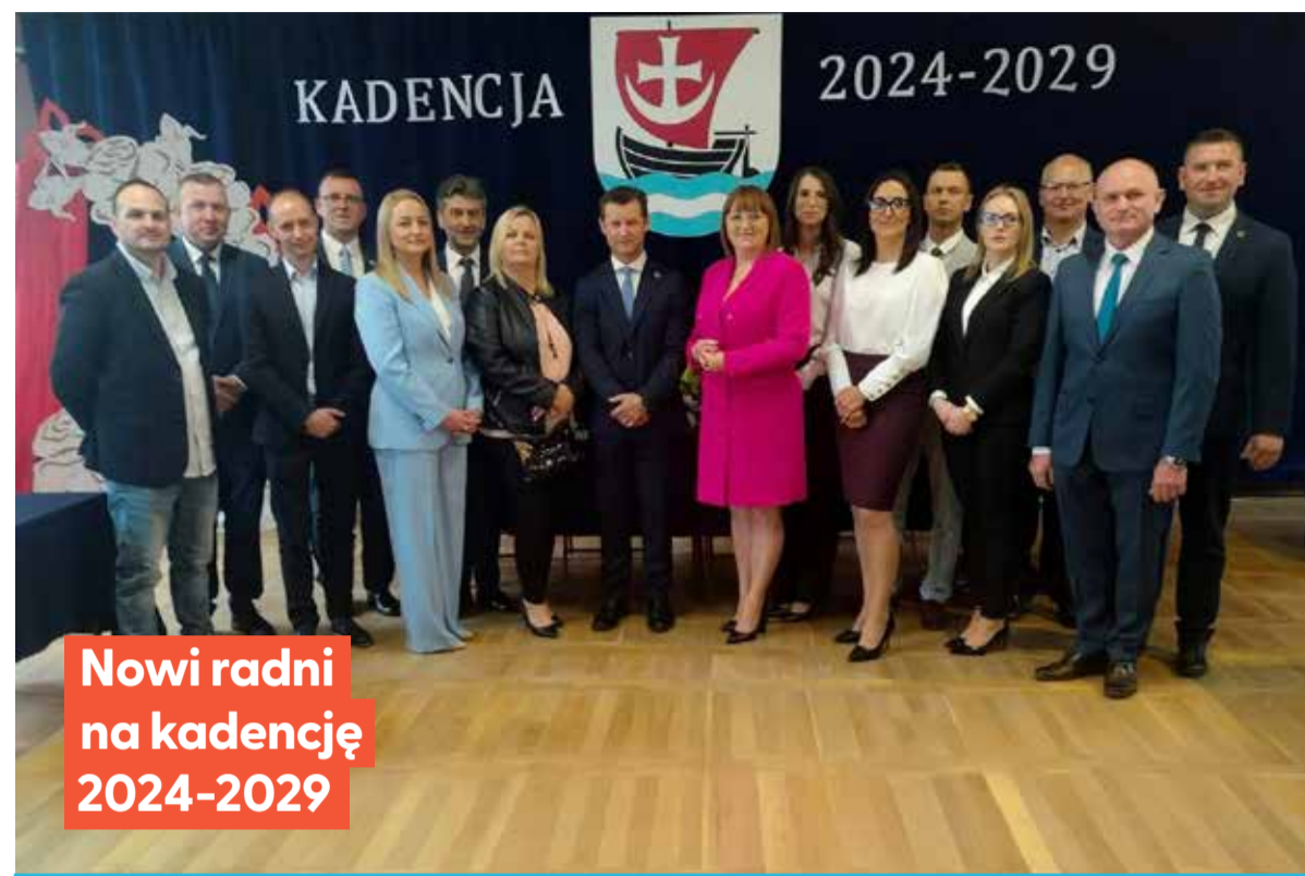
Nowi radni na kadencję 2024-2029

Nowa Rada Gminy Malczyce rozpoczyna swoją pracę z energią i zaangażowaniem, gotowa do po-