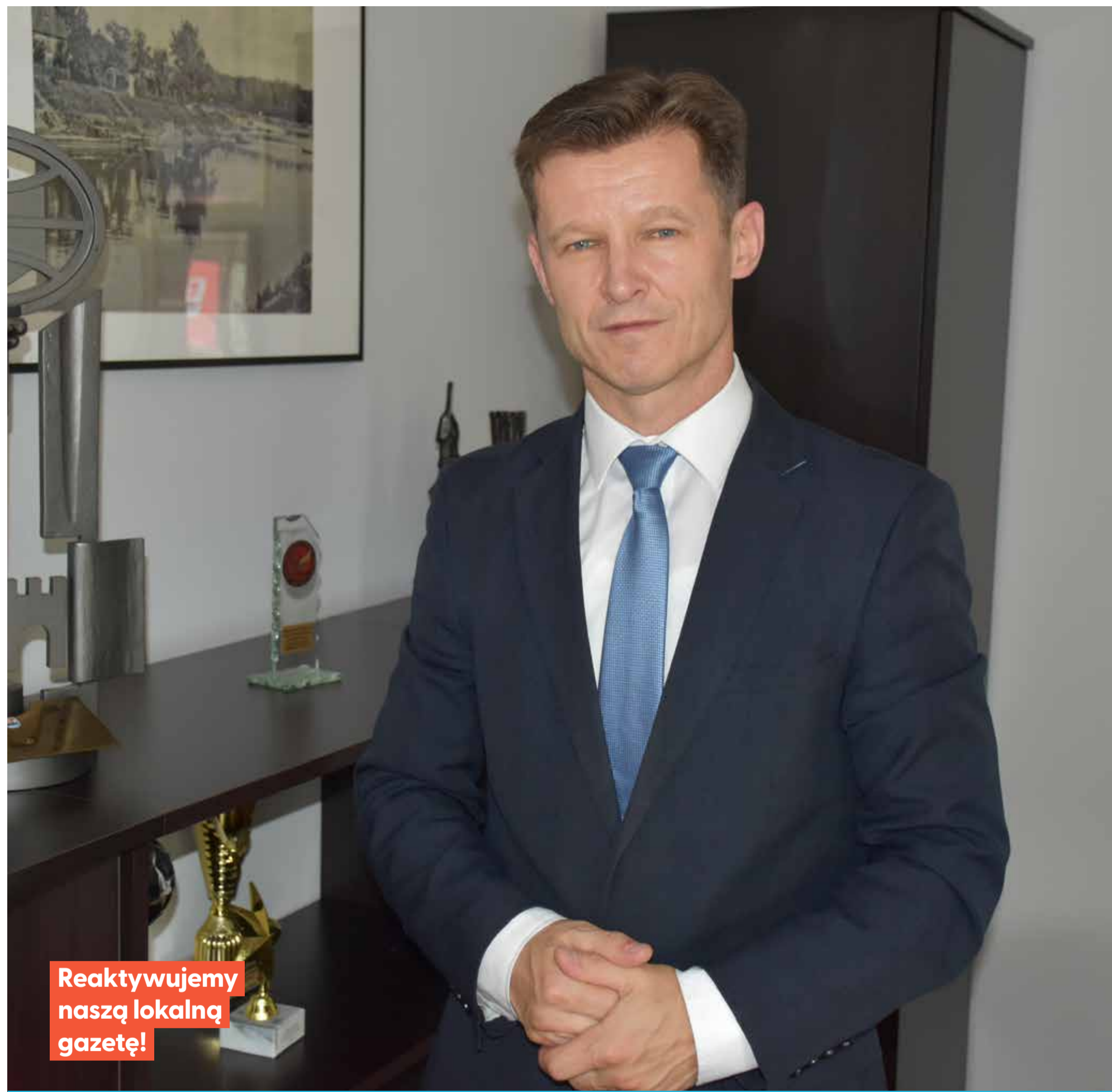
Reaktywujemy naszą lokalną gazetę!